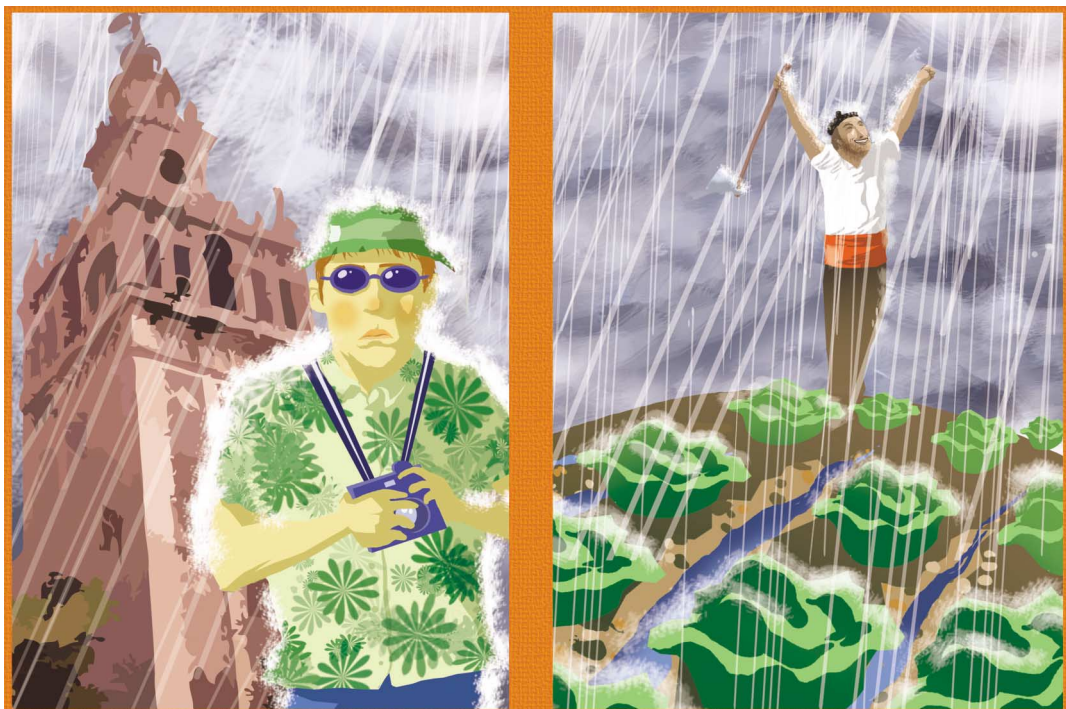
La lluvia es una maldición para el turista y una buena noticia para el campesino.