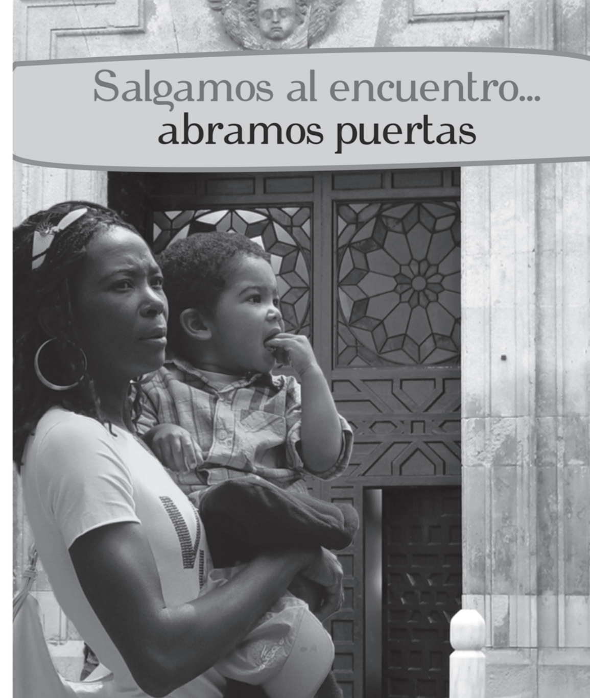
Mensaje de los Obispos de la Comisión Episcopal de Migraciones Día de las Migraciones 2012